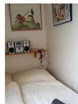
Blick ins 2. Schlafzimmer mit einem 1,40 m Bett