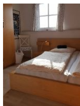
Schlafzimmer im OG