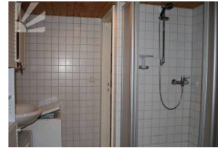
grosses Bsd mit Dusche, WC, Waschmaschine