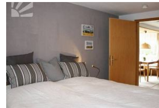
Schlafzimmer mit Einbauschränk